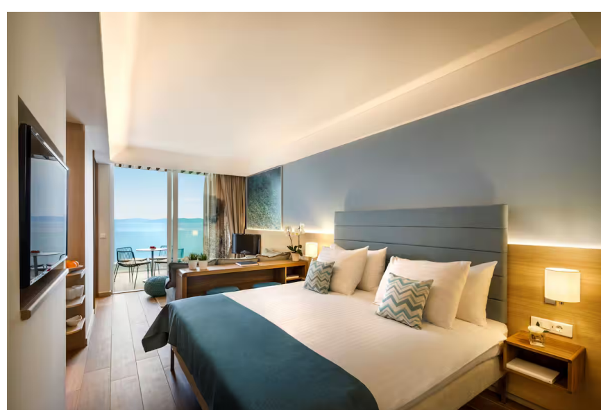
Nos chambres triples