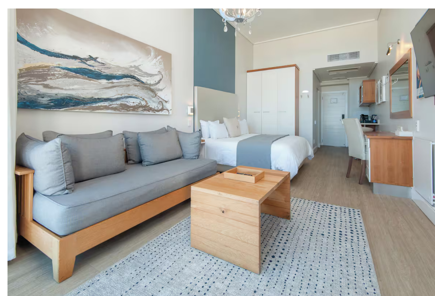
Chambres familiales / Suites