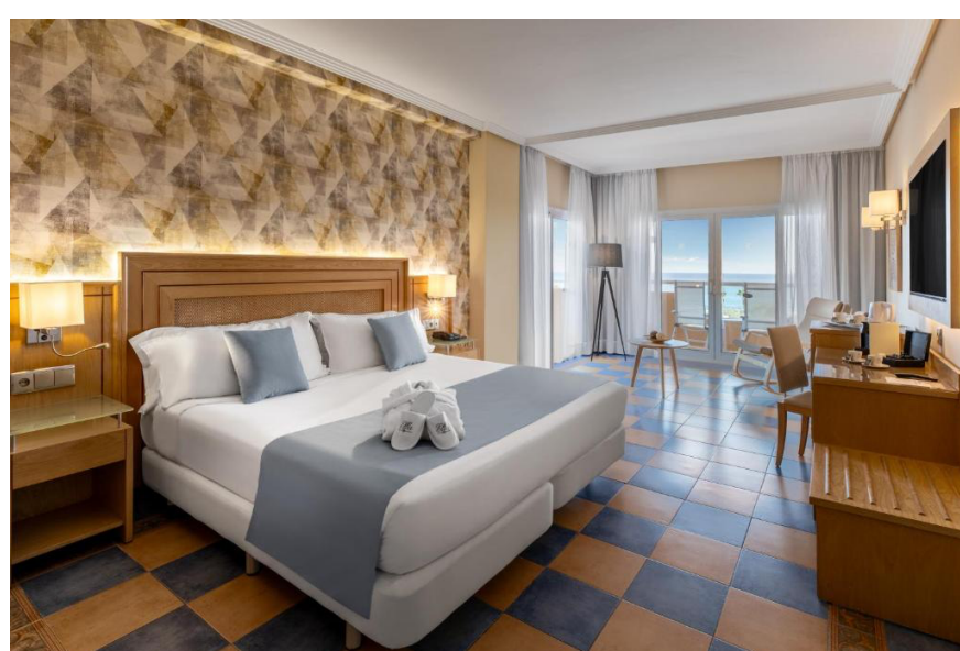
Nos chambres doubles